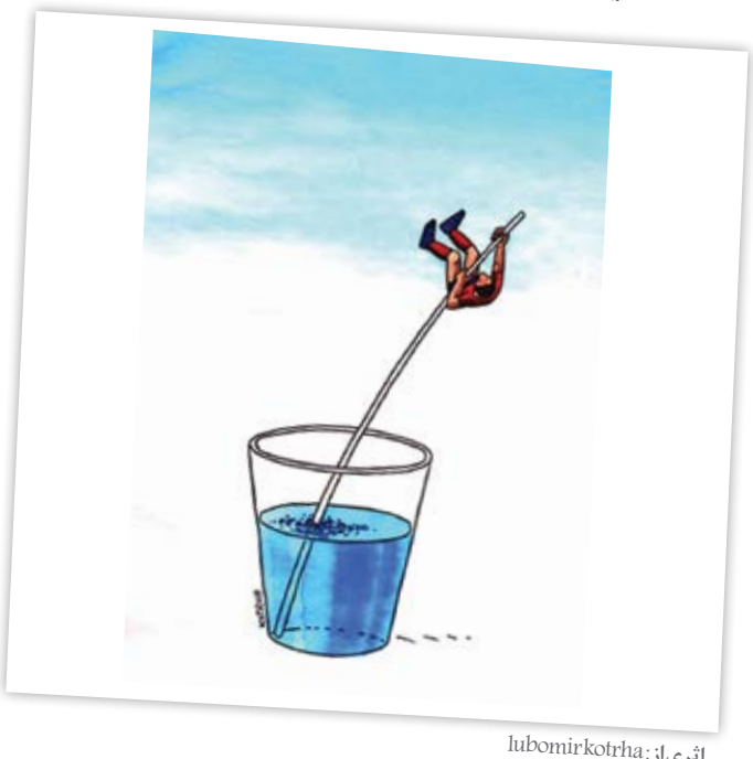
اثری از: lubomir kotrha